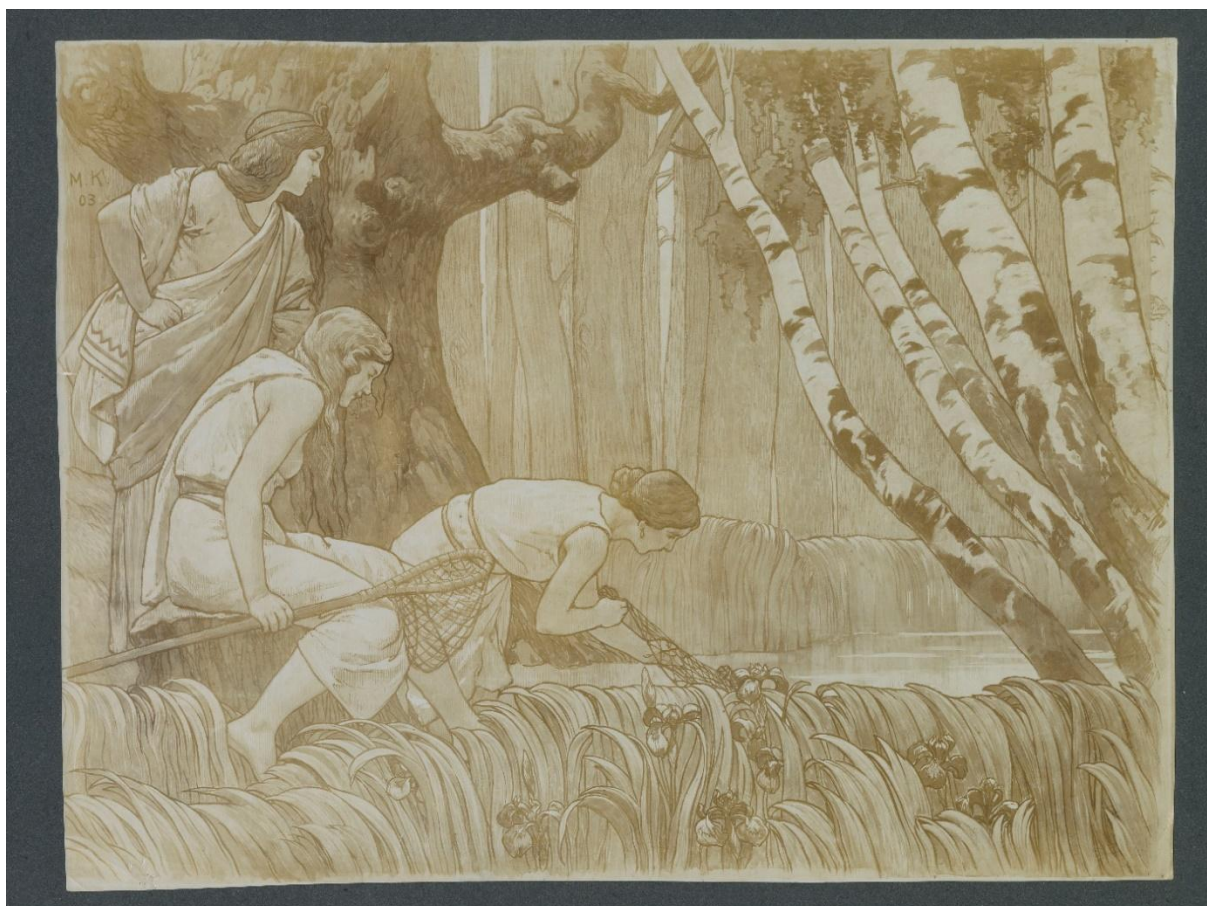
Fischfang von Max Koch, 1903, Ursprünglich im Speisesaal der Präsidentenwohnung im Preußischen Herrenhaus (Kriegsverlust) (U3/38/34)